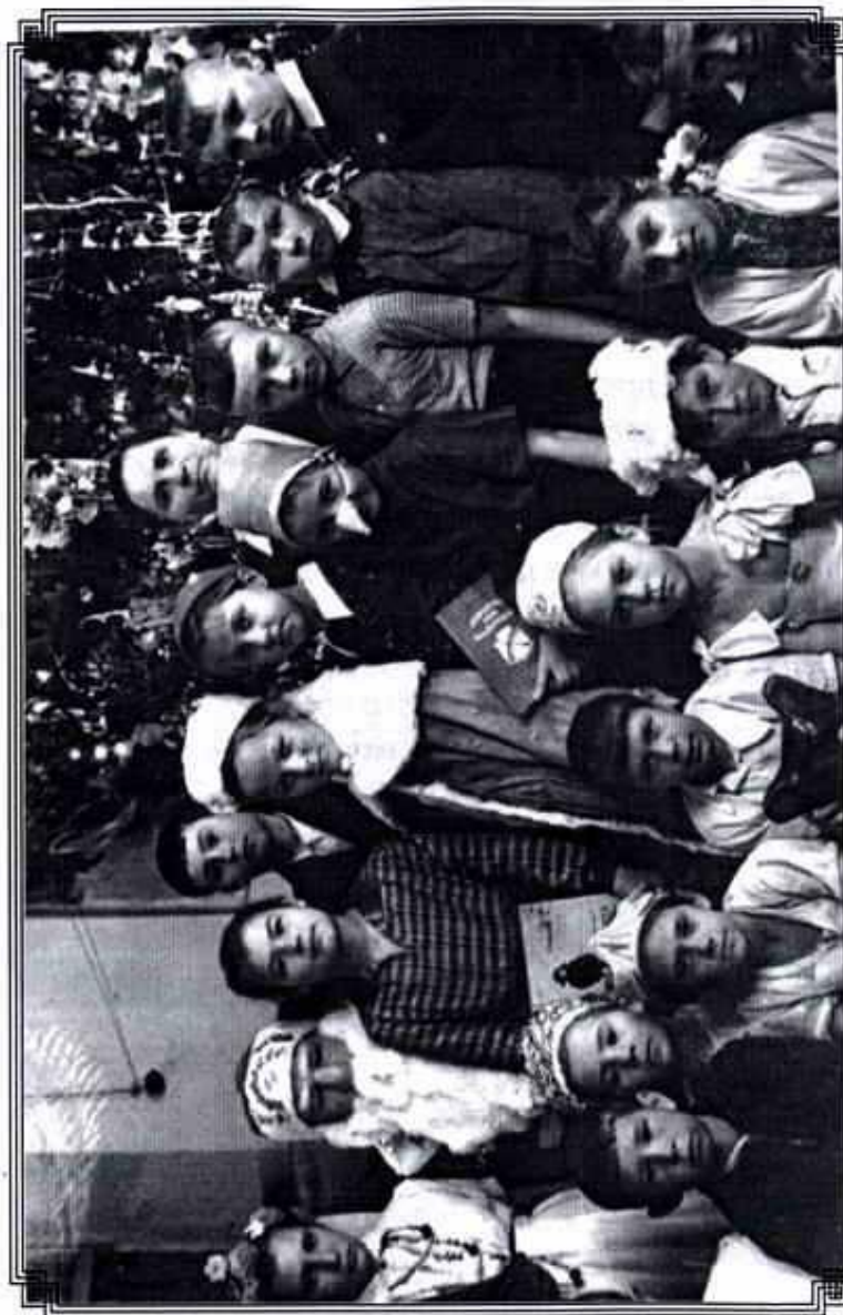
Школьная ёлка – 1962 год (городской краеведческий музей, зал Дворянского собрания)

Сегодня в зимней сказке я За главного героя. Иду аллейкой не спеша И память детства вороша, Скрипит снежок, И падают снежинки... В тот, мой далёкий, школьный год На ёлке я была Снегуркой, Со мной был Дедушка Мороз. Мы с ним водили хоровод Вокруг нарядной ёлки. Звучали песни и стихи. В костюмах дети танцевали. Все были очень веселы, Но и следить не забывали, Чтоб серый Волк и хитрая Лиса Подарки из-под ёлки не украли. Они в чудесном сундучке До времени лежали. Ах, это чудо из чудес – В героев сказки превращение! Мы победили, наконец, И Волк с Лисой у нас Просил прощения. Героев всех подарки ждут За их упорство и за труд, Ну и, конечно, в качестве прощения Лисице с Волком – наше угощение! ...Зима из детства принесла Мои любимые снежинки, Они сверкают ярко, Упав в ладонь подарком.