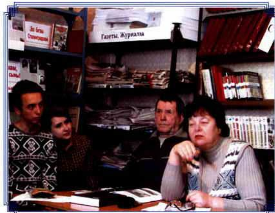
Выступление на встрече с читателями. Январь 2017 года